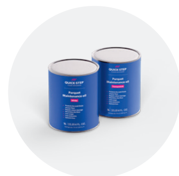
Huile d'entretien 1 L QSWMAINTOILN / QSWMAINTOILW

Avec ce kit, réparez facilement les dommages légers et rafraîchissez la couleur d'origine de votre sol. Pour obtenir des instructions détaillées pas à pas, rendez-vous sur quickstep.com .