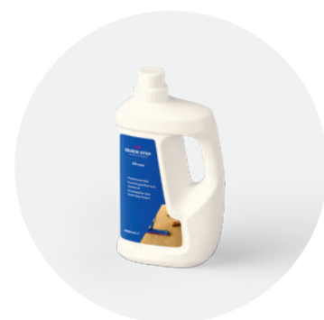
Huile de soin QSWOILCARE1000

Le kit de nettoyage comprend un balai avec réservoir de produit d'entretien rechargeable et gâchette pratique pour humidifier et nettoyer facilement votre sol. Comprend également une serpillière en microfibres lavable et 1 L de produit d'entretien Quick-Step. Vous pouvez désormais nettoyer votre sol rapidement et durablement !