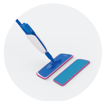
Kit de nettoyage QSSPRAYKIT

Ce produit d'entretien a été spécialement développé pour les sols Quick-Step. Il nettoie la surface à fond et préserve son aspect d'origine afin de vous faire profiter durablement de ce « nouveau sol ».